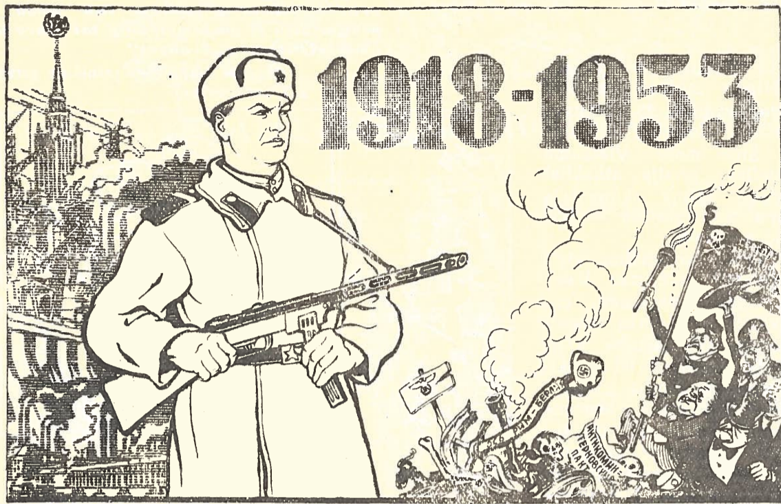
MES STIPRUS! SAUGOKIS, KARO KURSTYTOJAU, NEUŽMIRŠK, KUO BAIGIASI KARAI!