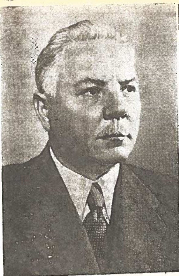
K. J. VOROŠILOVAS MININT 75-ĄSIAS GIMIMO METINES