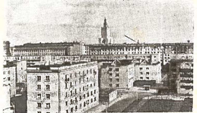
Nuotraukoje: naujai pastatytas Varšuvos kvartalas. Tolumoje — J. V. Stalino vardo kultūros ir mokslo rūmai.

mybą, naudodami mažiau rankų darbo. Didžiąją vaidmenį, socialistiškai pertvarkant Lenkijos kaimą, vaidina valstybinės mašinų-traktorių stotys, kurios aprūpinamos šiuolaikine technika. Jos turi daugiau kaip 20 tūkstančių traktorių (skaičiuojant 15-jėgiais). Tik 1955 metais MTS